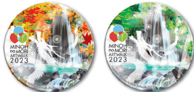
箕面の森アートウォーク2023缶バッジ(協賛者様限定仕様)