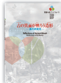
箕面の森アートウォーク2017作品集

ポスター「箕面旧絵図」 A2サイズ両面仕様 江戸時代(1796)に発行され た「攝津名所図會」に描 かれた箕面の風景をCGで 再現。